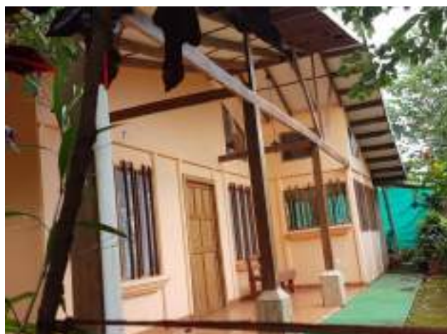
Obra tasada con directriz en San Gabriel