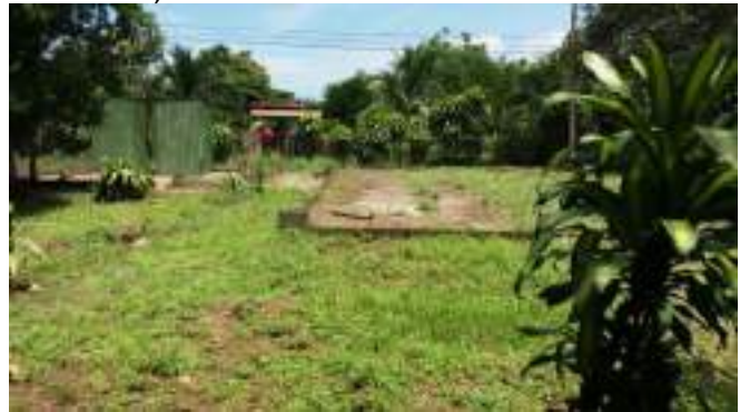
Uso de suelo otorgado en San Pablo