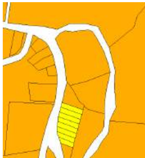
Dibujo Proyecto lotificación en Las Delicias