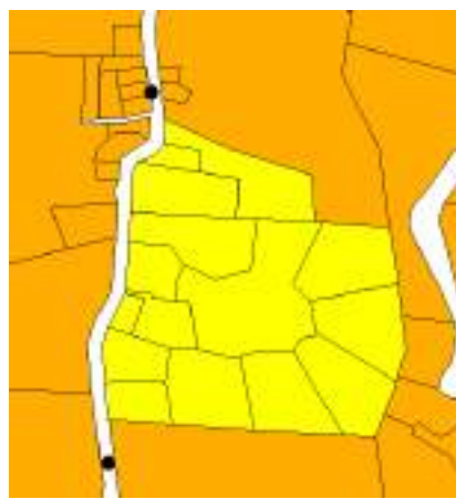
Dibujo de predios en Parcelas de Bijagual