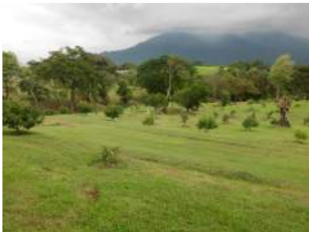
Visado de plano en El Barro