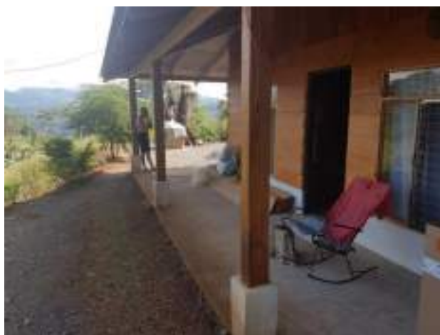
Obra tasada con directriz en San Gabriel

A continuación el incremento que se ha obtenido durante el periodo en estudio a partir de lo mencionado en los párrafos anteriores: