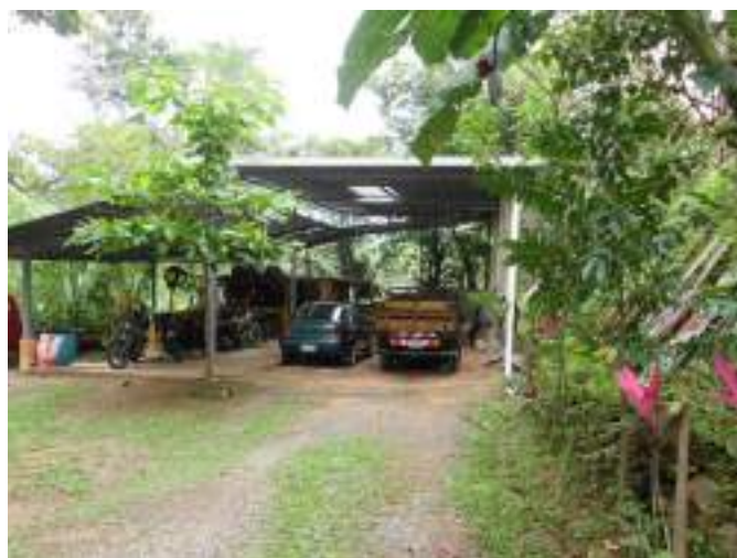
Visado de plano en San Pedro