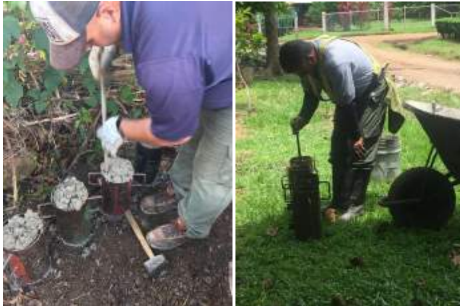
Fotografía 4. Pruebas de Resistencia de testigos cilindros de concreto AASHTO T 22 (ASTM C39).