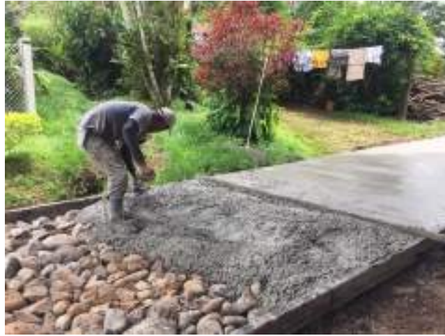
Fotografía 3. Camino 1-16-131 y 1-16-132 y 1-16-056, Colocación de concreto.