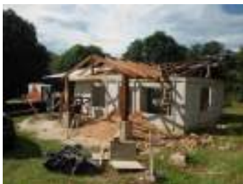
Obra con permiso en San Pablo

La Comisión de Obras inició labores a partir del mes de mayo del 2017 y continúa aun trabajando durante este año 2018, misma que no se encuentra recibiendo ni horas extras ni retribución de un plus de disponibilidad por dicha tarea, lo hacemos con el afán de colaborar con la Institución a la espera de que se resuelvan asuntos internos que impiden que dichas funciones las realice un profesional dedicado exclusivamente a esa labor.