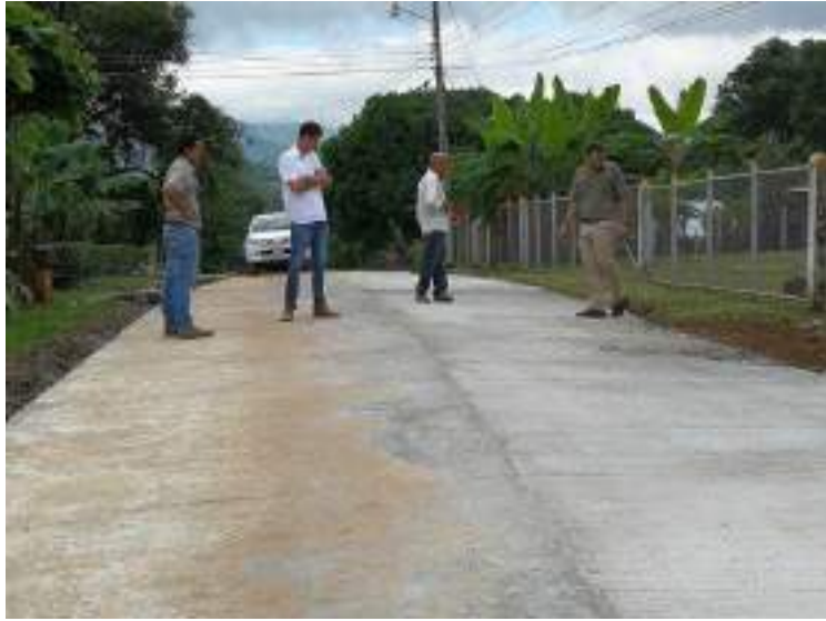
Fotografía 7. Recepción del proyecto, camino 1-016-056.