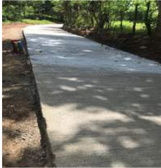
Fotografía 5. Aplicación del curador. KUREZ VOX WHITE, camino 1-016-114.