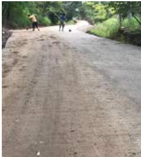
Fotografía 6. Limpieza previa a la entrega del proyecto, camino 1-016-114.