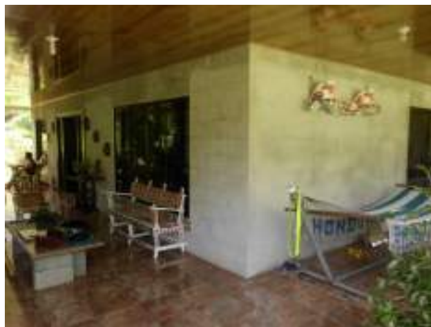
Obra tasada con directriz en San Antonio