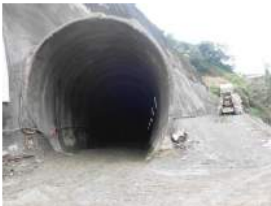
Obra con permiso Túnel en P.H. Capulín San Pablo