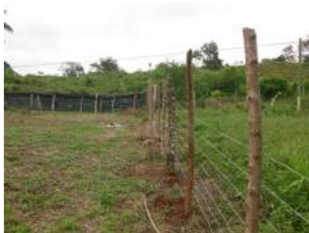
Visado de plano en Montelimar