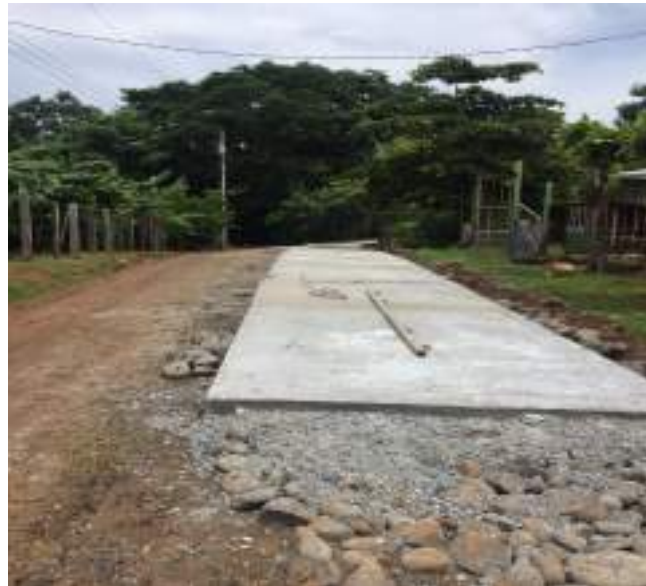
Fotografía 2. Camino 1-16-131 y 1-16-132 y 1-16-056, La superficie anterior era de Lastre tierra.