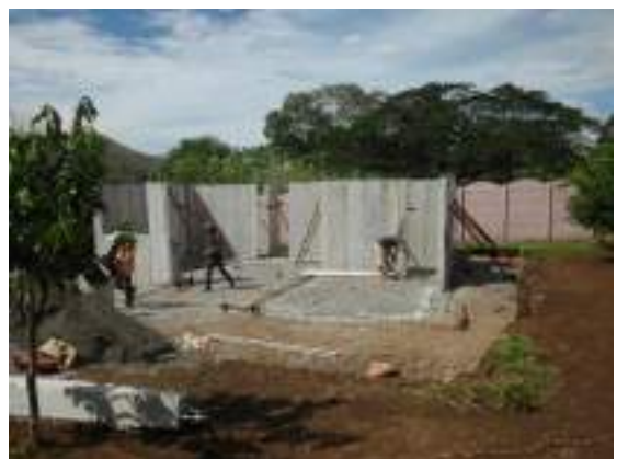
Obra con permiso municipal en San Pablo