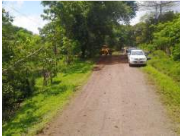
Fotografía 1. Caminio 1-16-076 y 1-16-114, La superficie anterior era de Lastre tierra.

Fotografías del antes, durante y acabado de la intervención