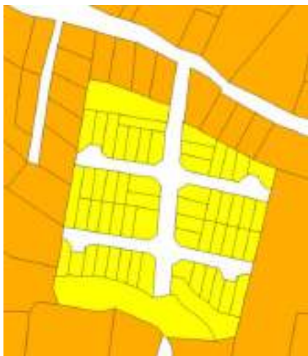
Dibujo Conjunto Residencial Turrubares