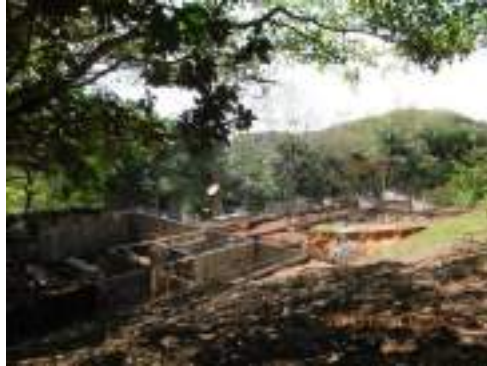
Obra con permiso en Hda. Los Manantiales, S.Pedro