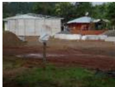
Obras con permiso en Las Delicias, Cara