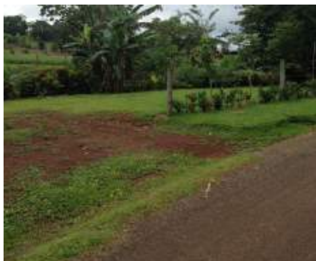
Visado de plano en Bijagual