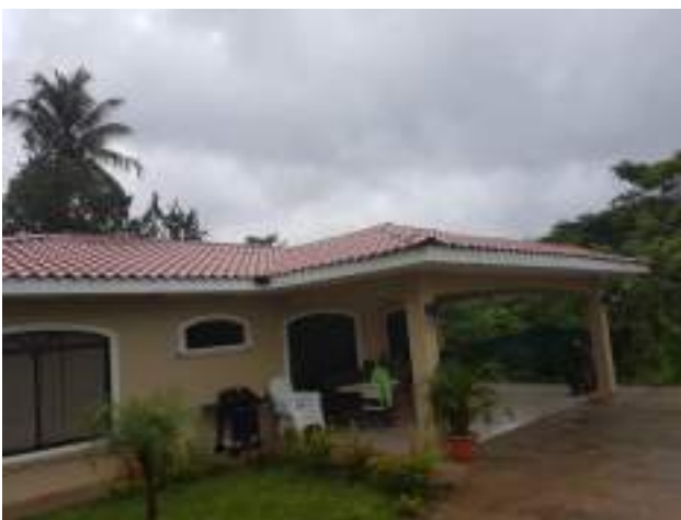
Obra tasada con directriz en Montelimar

Por último, en materia de valoración de propiedades y por medio de Directriz de la Alcaldía Municipal, se han realizado tasaciones de construcciones ya concluidas que no contaban con permiso municipal y que eran de suma importancia en materia tributaria para la Municipalidad. Se continuara con este procedimiento con el objeto de regularizar a los omisos de esta licencia y homegenizar con las propiedades vecinas que si han ajustado los valores de sus terrenos y construcciones para cumplir con la justicia tributaria que demanda la ley.